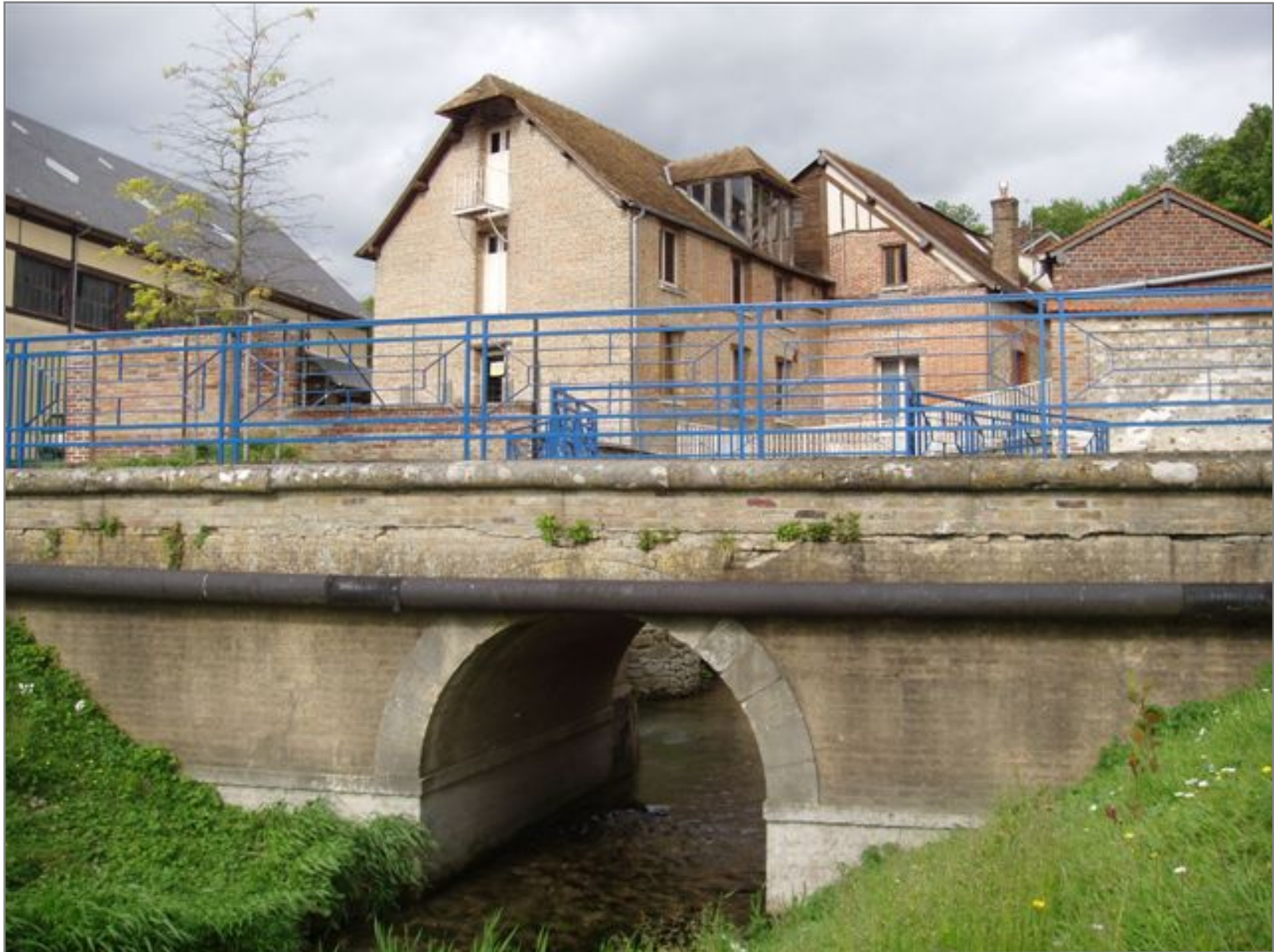
Le Gambon se jette dans la Seine au niveau du port après un dernier passage sous un ancien moulin.